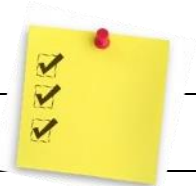
TABLEAU SYNTHÈSE FRAIS DU SERVICE DE GARDE